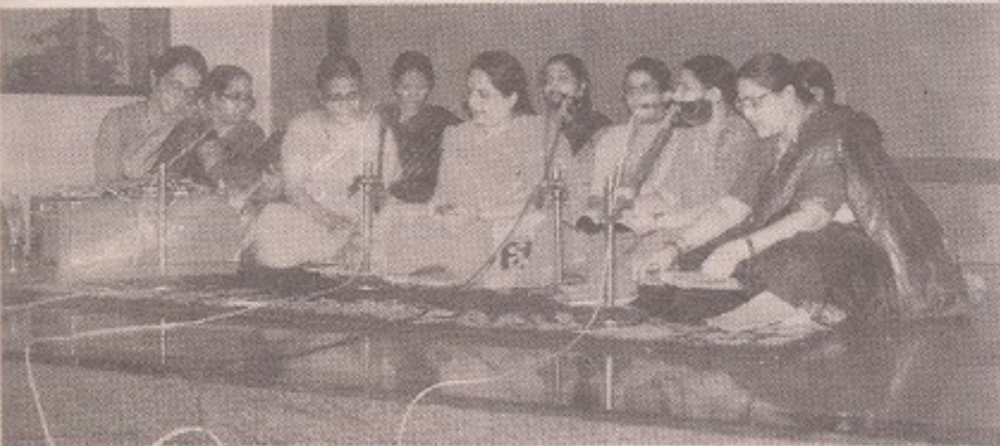
ವಾಶಿ ಕನ್ನಡ ಸಂಘದ ಮಹಿಳಾ ವಿಭಾಗದಿಂದ ಹಾಡುಗಾರಿಕೆ

ತಾ. 12-9-97ರಂದು ಅಸೋಸಿಯೇಷನ್‌ನಲ್ಲಿ 7ಘಂಟೆಗೆ ಮಹಿಳೆಯರಿಗೆ ಅರಿಶಿನ ಕುಂಟುಮದ