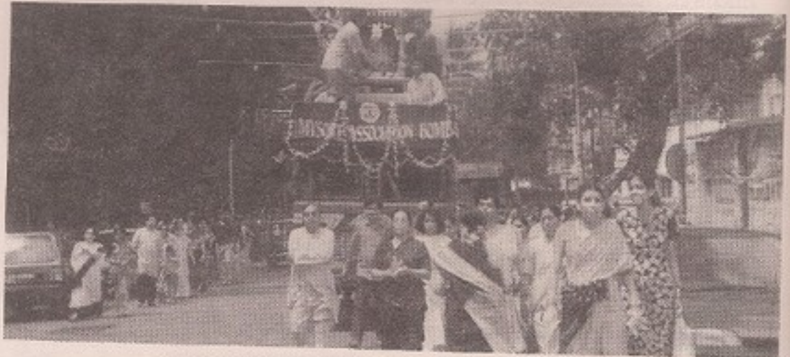
ಶ್ರೀ ಸ್ವರ್ಣಗೌರಿ ಮತ್ತು ಶ್ರೀ ಮಹಾಗಣಪತಿ ವಿಸರ್ಜನಾ ದಿನ ಮೆರವಣಿಗೆ.