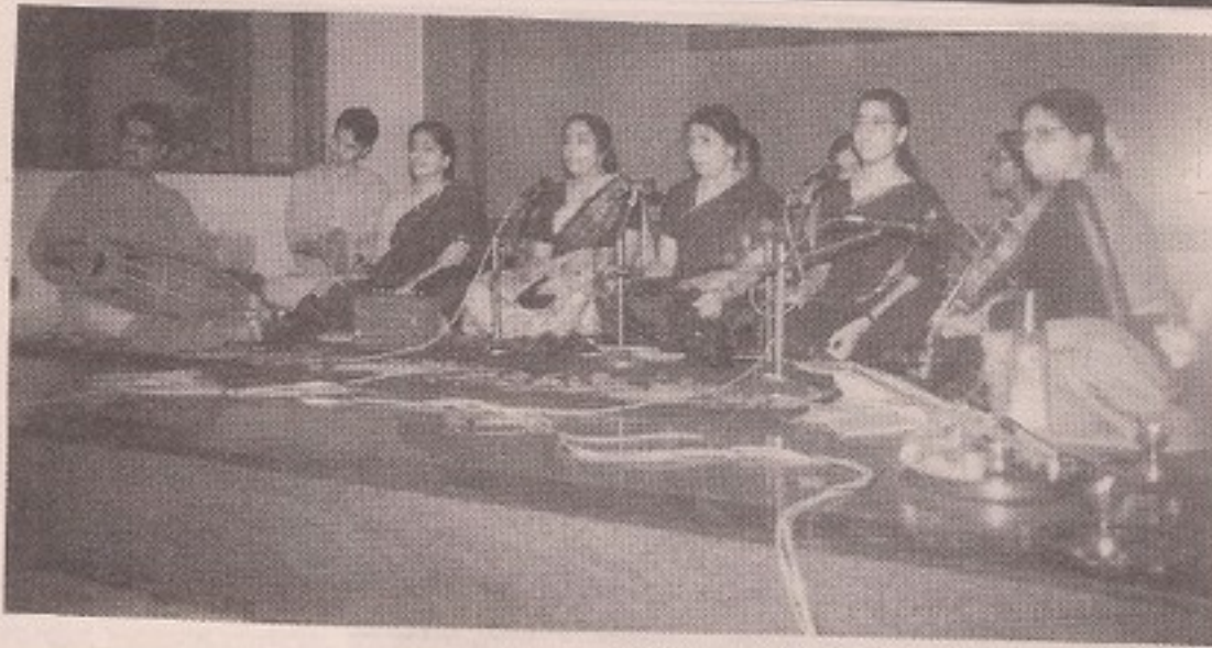
ಸಿಂಧು ಭವಿ ತಂಡದವರು