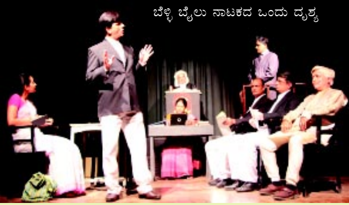
ಬೆಳ್ಳಿ ಬೈಲು ನಾಟಕದ ಒಂದು ದೃಶ್ಯ