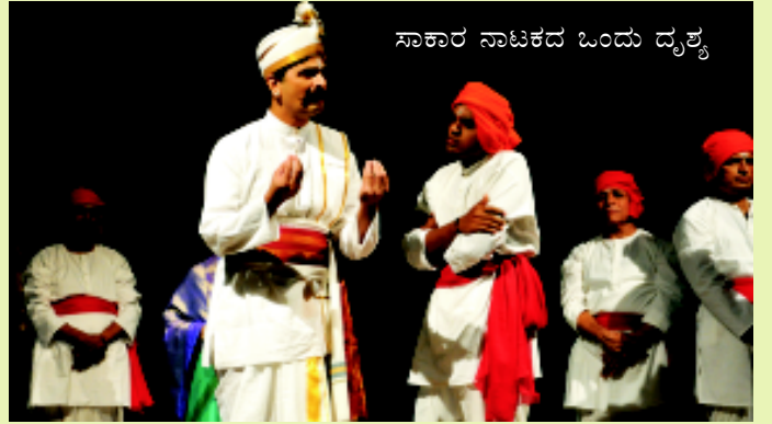
ಸಾಕಾರ ನಾಟಕದ ಒಂದು ದೃಶ್ಯ