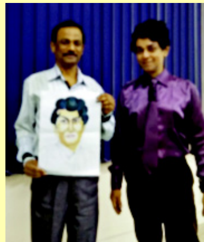
ಸಾಂಸ್ಕೃತಿಕ ದಿನಾಚರಣೆಯ ಸಂದರ್ಭ ಮಕ್ಕಳ ಹಸ್ತ ಕಲಾ ಪ್ರದರ್ಶನದ ವೇಳೆಯಲ್ಲಿ ಅವರ ಗುರುಗಳು ಮಾಡಿದ ವ್ಯಕ್ತಿ ಚಿತ್ರಣ.