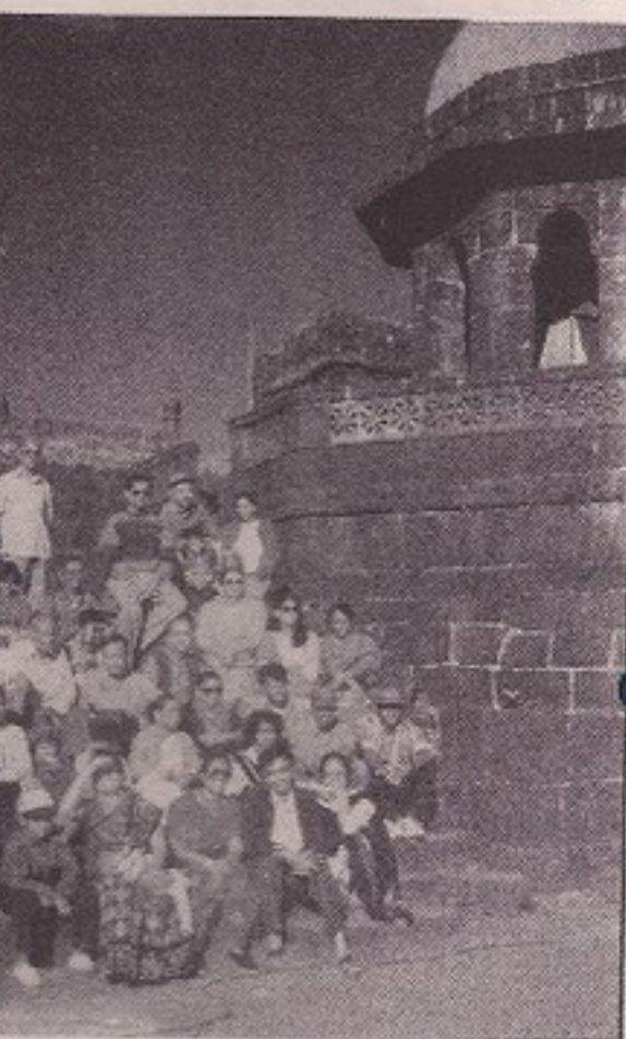
ಶಿವಾಜಿ ಮಹಾರಾಜರ ಸಮೂಹವು ಬಯಲಲ್ಲಿ ಸದಸ್ಯರ ತಂಡ.

ಮಾರನೆಯ ದಿನ ಎಲ್ಲರೂ ಬೆಳಗ್ಗೆ ಬೇಗ ಎದ್ದು, ಸ್ನಾನಾದಿಗಳನ್ನು ತೀರಿಸಿಕೊಂಡು ಸೂರ್ಯೋದಯ ನೋಡಲು ಕೆಲ ಉತ್ಸಾಹಿಗಳು ಹೊರಟೆವು. ಎತ್ತರದ ಜಾಗ ಅರಿಸಿ ನಿಂತಾಗ ಅದಾಗಲೇ ಗೊಡು ಬಿಟ್ಟು ಹಾರುತ್ತಿರುವ ಹಕ್ಕಿಗಳು, ಅಲ್ಲಲ್ಲಿ ಹೆಸರೆಯದ ಹೂವು ಬಿಟ್ಟು ಗಿಡಗಳು ಸೂರ್ಯನ ಸ್ವಾಗತಕ್ಕೆ ಆಸೆಯಾದ ಉಚಿತಕಾಶದಲ್ಲಿ ಚೆಲ್ಲಿದ ಬ್ಯಾಬ್ಬಾದ ಸೊಬಗಿನ ನೋಟ ಮನಮೋಹಕವಾಗಿತ್ತು. ಹಿಂತಿರುಗಿ ನೋಡಿದರೆ, ಪಕ್ಕಕ್ಕೆ ಕಣ್ಣು ಹೊರಳಿಸಿದರೆ ಕಳಗಿನ ಕಣವೆಯಲ್ಲಿ ಬದಕಲಾಗಿ ಹರಿಯುತ್ತಿದ್ದ ಗಾಂಧಾರಿ ಮತ್ತು ಸಾವಿತ್ರಿ ನದಿಗಳನ್ನು ಕಾಣುತ್ತಿರುವ ವೇಳೆಗೆ, ಸೂರ್ಯ ತನ್ನ ಮೊಡಗ ಮನೆಯಿಂದ ಮೆಲ್ಲ ಮೆಲ್ಲಗೆ ಮೇಲೇರುತ್ತಿರುವ ದೃಷ್ಟಿ ಮೋಹಕವಾಗಿತ್ತು. ಸೂರ್ಯೋದಯ ನೋಡಿ ಬಂದ ನಾವು ಕಾರ್ಪಿ, ಟೀ,