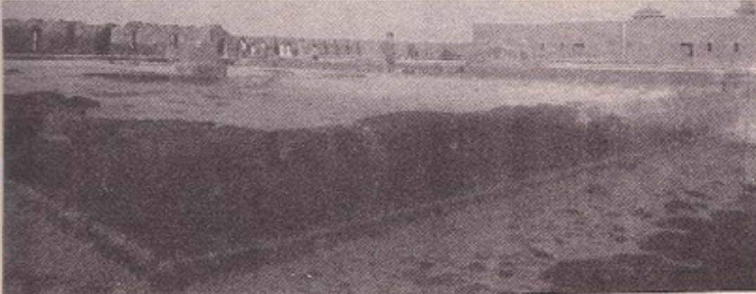
ರಾಯಘಡ ಕೋಟೆಯ ಒಳ ಆವರಣ.

ತೆಗೆದು ಕೊಂಡು ಮೇಲೆ ತಂಡ, ತಂಡವಾಗಿ ತಲಬಿಡೆವು. ಬೆಟ್ಟದ ನೆತ್ತಿಯ ಮೇಲೆ ತಲಪುತ್ತಿದ್ದಂತೆಯೇ ವಿಶಾಲವಾದ ದಿಣ್ಣೆ, ತಗ್ಗುಗಳಿಂದ ಕೂಡಿದ ಭೂಭಾಗ ಕಂಡಿತು ಹಾಗೂ ಒಂದು ಕಡೆಯ ಕೋಟೆ ಮೇಲೆ ಹೋದ ಮೇಲೆ ಕಾಣಿಸಿತು. ಕೆಳಗಿನಿಂದ ನೋಡಿದರೆ ಕೋಟೆ ಮೇಲೆ ಇದೆಯೆಂದು ತಿಳಿಯುವುದೇ ಇಲ್ಲ. ಇದೇ ಇದರ ವೈಶಿಷ್ಟ್ಯ. ರಾಯಘಡ ನಾನಾ ಬೆಟ್ಟಗಳಿಂದ ಅಡ್ಡತನಾಗಿದ್ದು ತಳಭಾಗದಲ್ಲಿ ಸಮತಲ ಭೂಪ್ರದೇಶ ಇಲ್ಲವೆಂದೇ ಹೇಳಬೇಕು ಹಾಗಿದೆ.