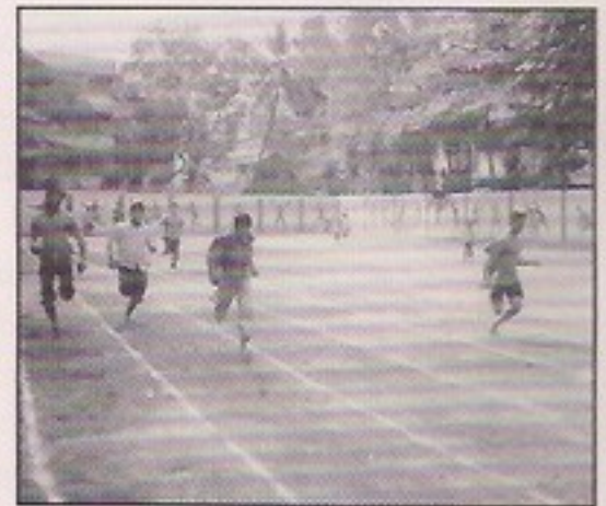
Men participating in running race.

A large number of people ranging from children below 5 years to those in their late sixties enthusiastically took part in the events.