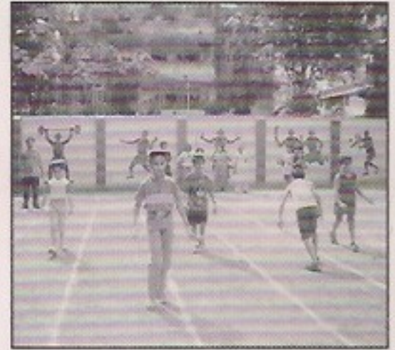
Children 6 to 9 participating in balancing the book race

Every year, the Association holds annual sports meet for its members, members' children and staff. This year this meet was held on 16th January 2005, at the N.K.E.S. School grounds at Wadala.