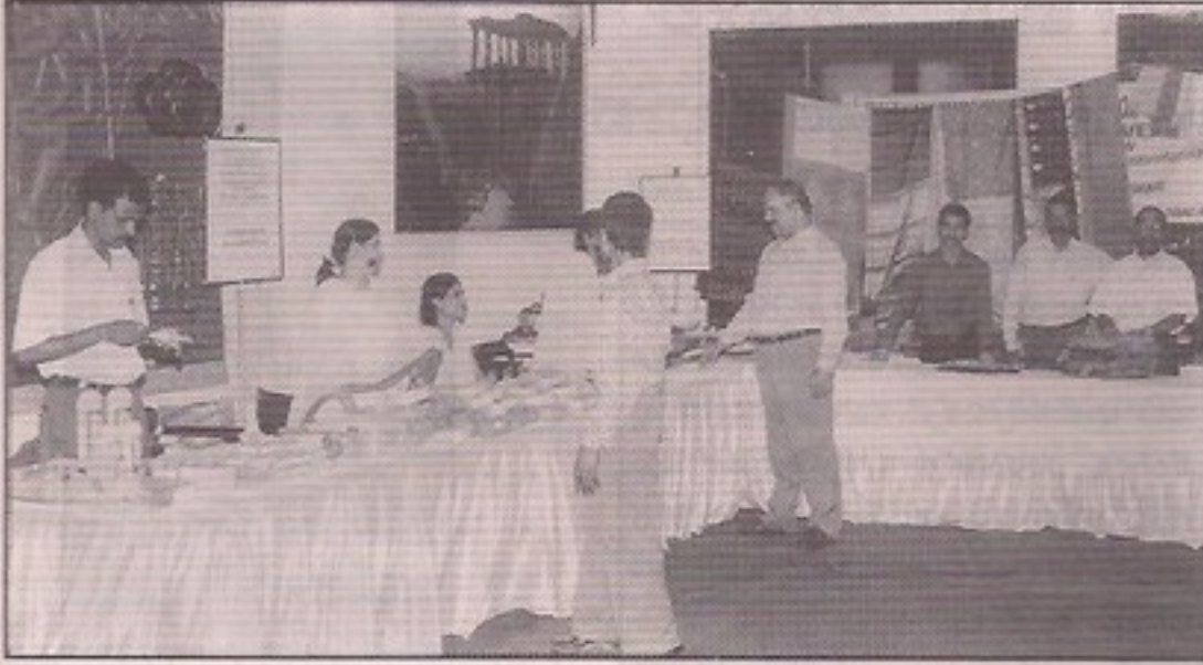
ಮೈಸೂರು ಸೇಲ್ಸ್ ಇಂಟರ್‌ನ್ಯಾಷನಲ್‌ರವರು ಮೈಸೂರು ರೇಶ್ಮೆ ಸೀರೆ ಮತ್ತು ಇತರ ವಸ್ತುಗಳ ಪ್ರದರ್ಶನ ಹಾಗೂ ಮಾರಾಟ ಏರ್ಪಡಿಸಿದ್ದರು.