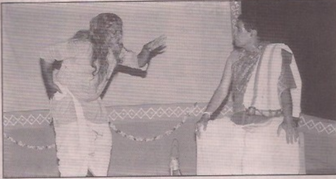
'ಸತ್ತವರ ನೆರಳು' ನಾಟಕದ ಒಂದು ದೃಶ್ಯ

ಸೂಚಿಸುತ್ತಾ, ಪಾತ್ರಗಳ ಅಂತರಂಗದ ವ್ಯಾಪಾರಗಳನ್ನು ವಿಮರ್ಶಿಸುತ್ತಿದ್ದ ಹೆಚ್ಚಿನ ಪಾತ್ರವಂತೂ ತುಂಬ ಪರಿಣಾಮಕಾರಿಯಾಗಿತ್ತು.