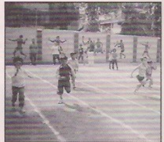
Children below 5 participating in running race.