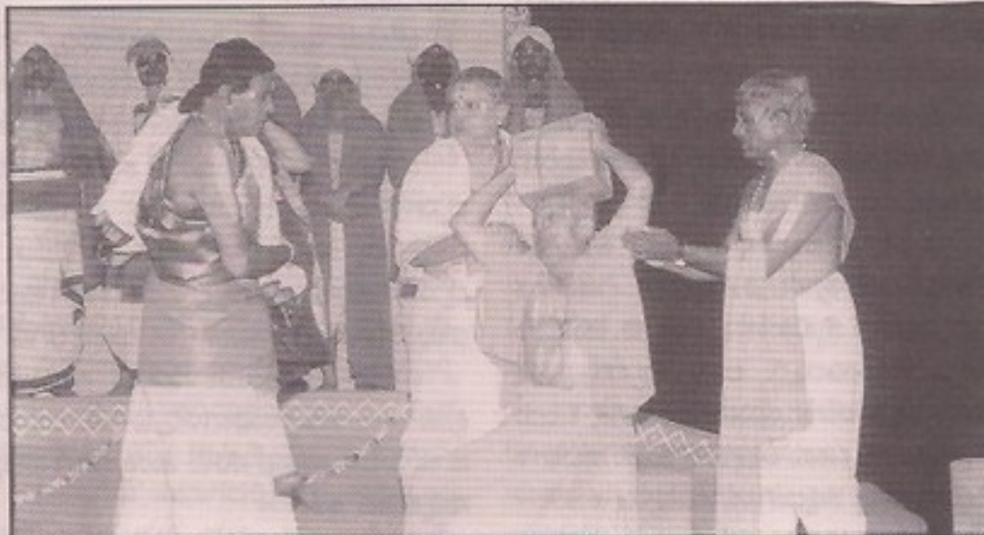
'ಬೆನಕ' ಅದರ 'ಸತ್ತವರ ನೆರಳು' ನಾಟಕದ ಒಂದು ದೃಶ್ಯ

ಸಂಸ್ಕೃತ ಸಂಭಾಷಣೆಗಳೂ ಸೇರಿದಂತೆ, ಸ್ಪಷ್ಟವಾದ ಉಚ್ಚಾರಣೆ, ಸಾಂದರ್ಭಿಕವಾದ ದಾಸರ ಪದಗಳ ಧಾರಾಳ ಬಳಕೆ, ಅಸಂಗತವಾದ ವಾದಸರಣಿಯೇ ತಾರ್ಕಿಕವೂ, ಸುಸಂಬಂಧವೂ ಆಗುವ ವೈರುಧ್ಯಗಳೆಲ್ಲ 'ಸತ್ತವರ ನೆರಳು' ರಂಗಪ್ರಸ್ತುತಿಯ ವೈಶಿಷ್ಟ್ಯಗಳಾಗಿವೆ. ಗ್ರೀಕ್ ನಾಟಕಗಳನ್ನು ನೆನಪಿಸುವ ಮೇಳದ ತಂತ್ರವೂ ಗಮನಾರ್ಹವಾಗಿದೆ. ಭೂತ ವರ್ತಮಾನ ಕಾಲ