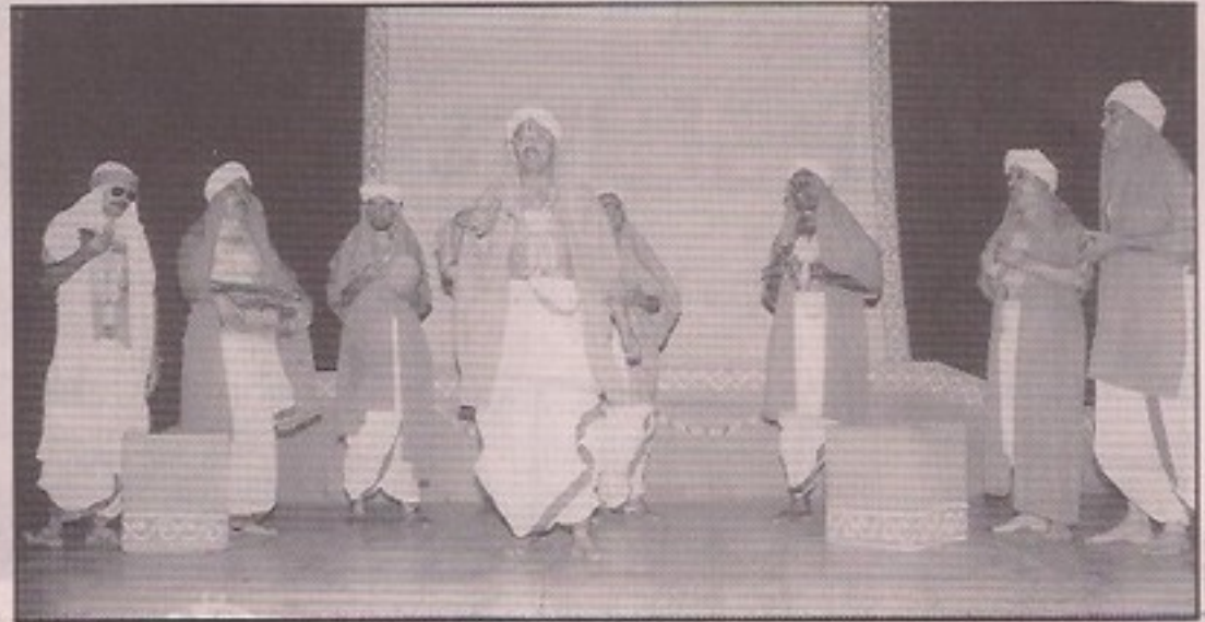
'ಕದಡಿದ ನೀರು' ನಾಟಕದ ಒಂದು ದೃಶ್ಯ