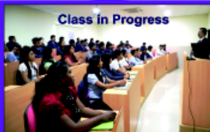
Class in Progress